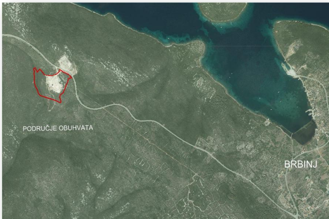
Slika 1: položaj zone obuhvata u odnosu na okolno područje (DOF 2011.)

Područje u obuhvatu UPU-a nalazi se u prostoru ograničenja, to jest unutar 1.000 m od obalne linije.