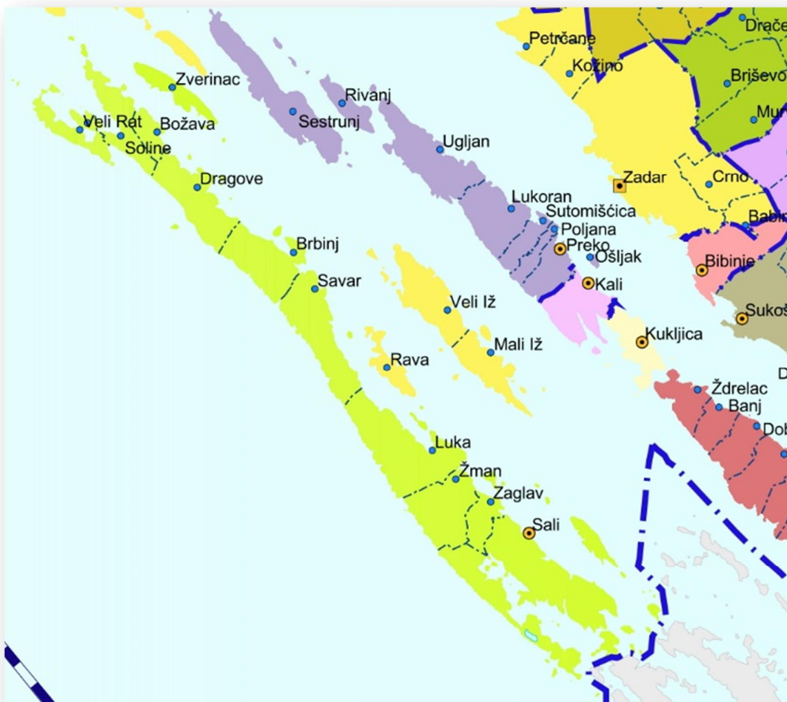
Slika 1: položaj i okruženje Općine Sali

Područje obuhvata Urbanističkog plana uređenja marine Veli Rat (u daljnjem tekstu UPU ili Plan ) nalazi se u naselju Veli Rat.