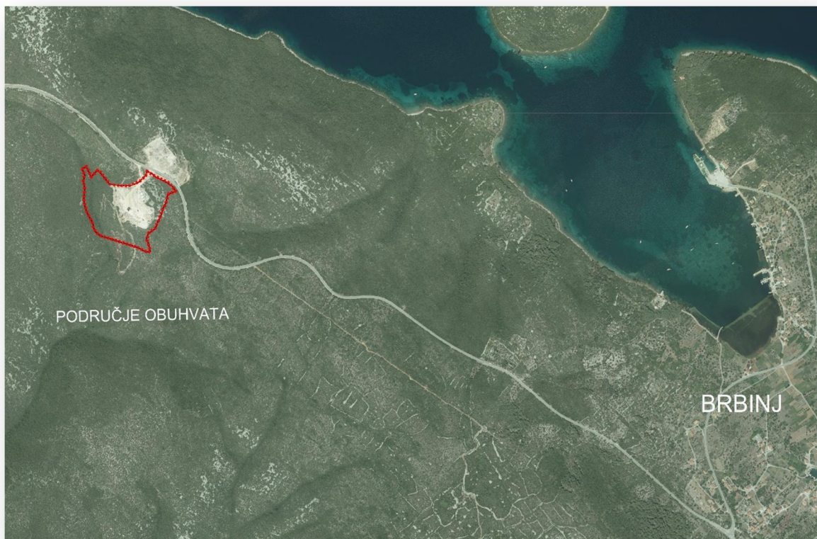
Slika 1: položaj zone obuhvata u odnosu na okolno područje (DOF 2011.)

Područje u obuhvatu UPU-a nalazi se u prostoru ograničenja, to jest unutar 1.000 m od obalne linije.